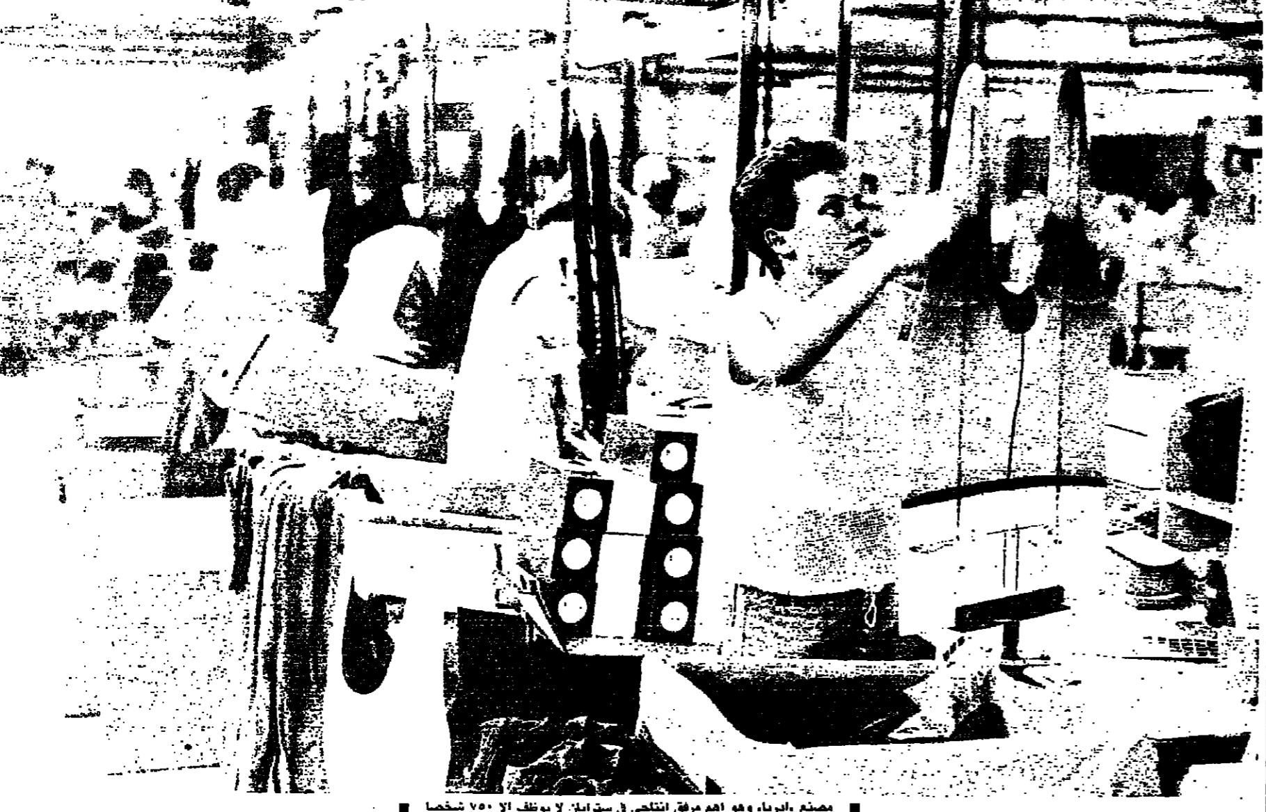
ممنوع، الدوا، وهو أهم مرفق انتاجي في سترابان لا يوظف الا ٧٥٠ شخصا